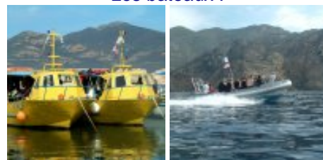
Les bateaux :