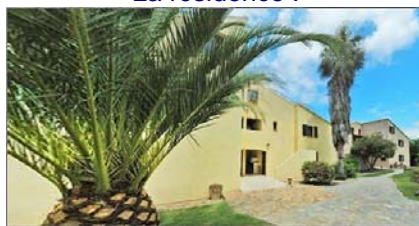
La résidence :